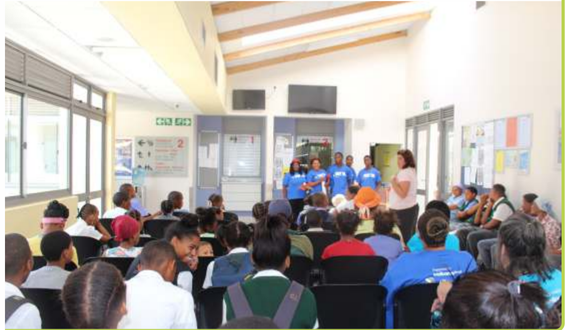
Opvoering by Rawsonville Kliniek.

Wil jy deelneem aan 'n fokusgroep om die Lienkie se Longe Dramate evalueer?