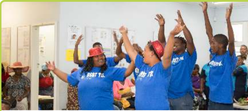
Die Beat TB Dramagroep in aksie by Empilisweni Kliniek, Worcester